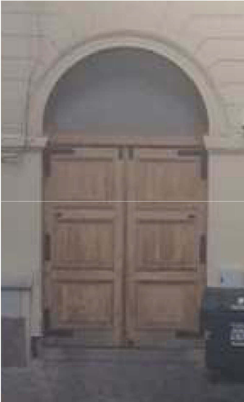
POHLED ZE DVORA